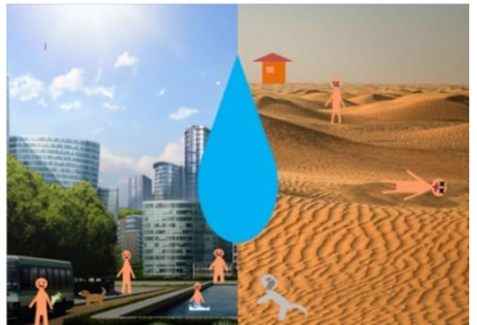
5. místo - Smolíková Natálie (2.L)