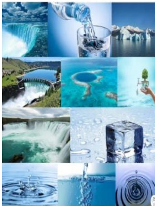
Voda- vzácná komodita současnosti