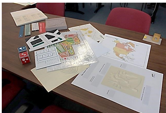
Haptické (hmatové) pomůcky