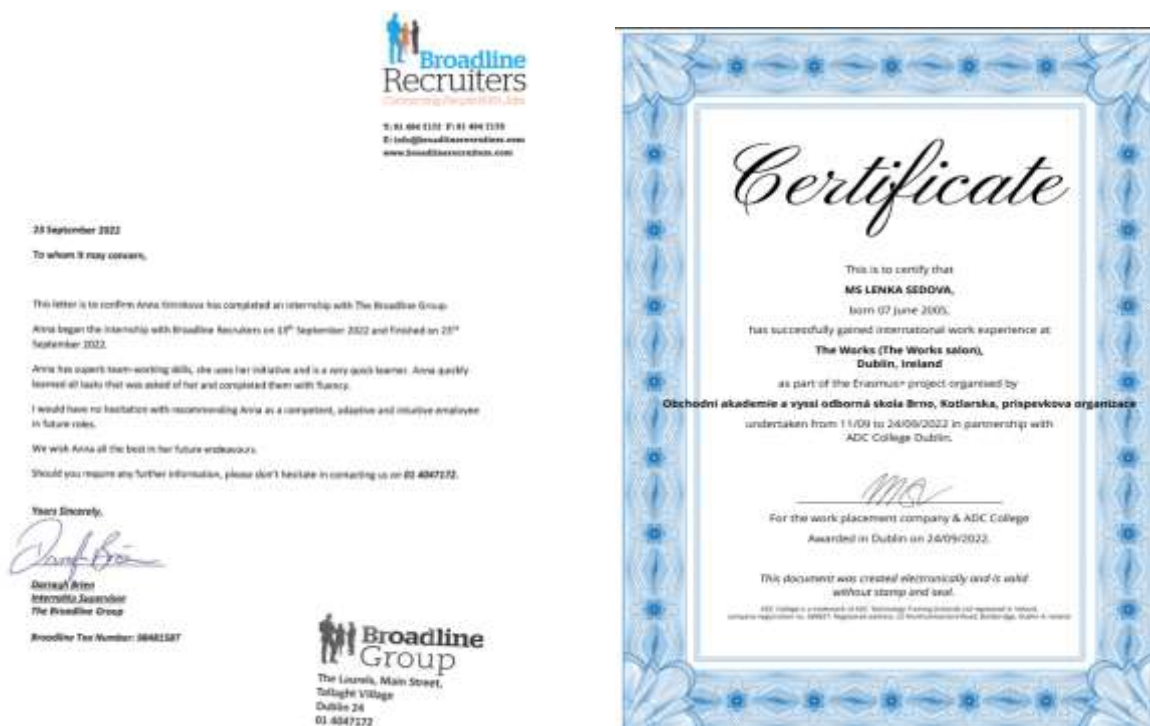
Ukázka účastnického certifikátu a referenci