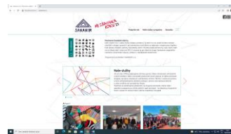
Poradenské centrum pro drogové a jiné závislosti