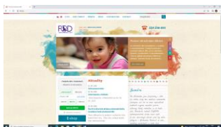
Linka bezpečí dětí a mládeže - poradenství rodičům s výchovou dětí