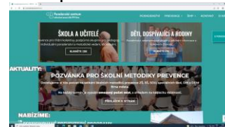
Podané ruce - léčba závislostí